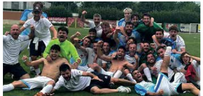
Tutto l'entusiasmo dei ragazzi della prima squadra dell'ASD Castrezzato che lo scorso anno hanno raggiunto un grande traguardo: la salita in Promozione

Un momento per celebrare il calcio, ma soprattutto l'amicizia, la partecipazione e lo spirito di Castrezzato.