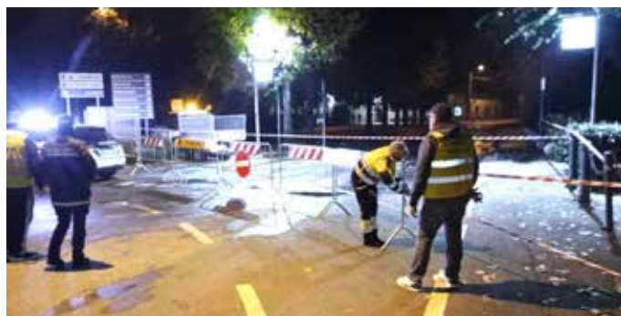
Gestione del traffico stradale in occasione dell'incendio di un pulmann di linea lo scorso ottobre operazione in sinergia con Carabinieri e Polizia Locale

La squadra continua a crescere e ad accogliere nuovi volontari . Il gruppo spesso partecipa ad esercitazioni fuori comune utili per migliorare la formazione dei soci. A breve il sodalizio comunale prenderà parte al progetto "Io non rischio" , promosso dal Dipartimento di Protezione Civile, con l'obiettivo di portare nelle scuole e tra i cittadini le buone pratiche di prevenzione.