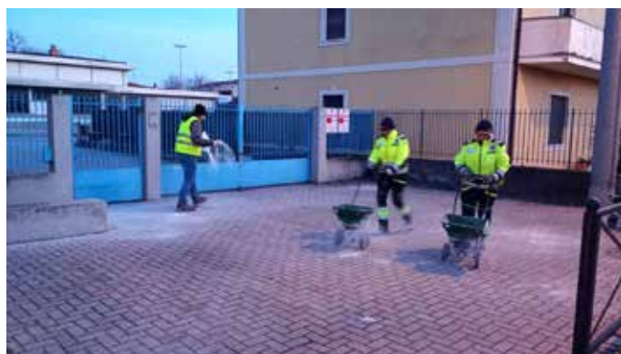
Spargimento sale in prossimità delle scuole