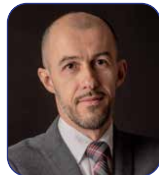
Luigi Cuneo Sindaco

“Il mio auspicio è che “La Voce di Castrezzato” diventi un appuntamento atteso, un piccolo ponte tra le varie realtà del paese, un collegamento tra memoria e futuro”