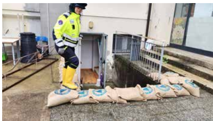
Messa in sicurezza di cantine e scantinati in vista dell'allerta meteo della scorsa estate